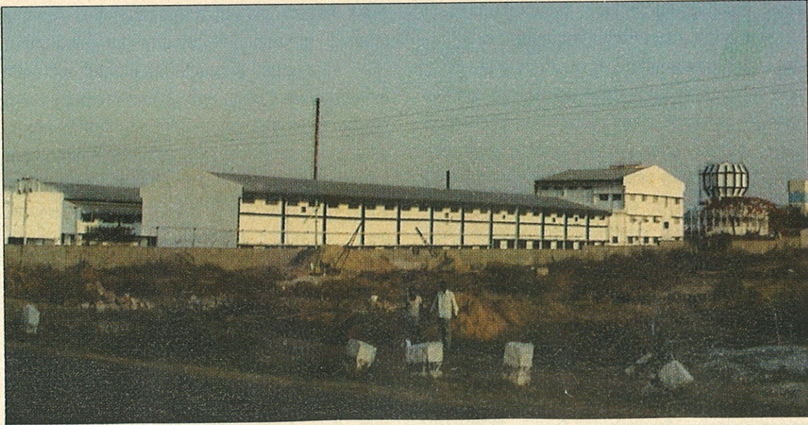
● हैदराबाद कारखाना

अतिशय नाजूक, अवघड आणि आत्मघातकी असा हा विषय असला तरी जैन उद्योगाचा शेतीशी असलेला घट्ट संबंध, बांधिलकी तसंच शेतकऱ्यांचा विश्वास, गुडविल, भरवसा यांमुळं इथंही आम्ही यशस्वी होऊ. देशाचं यात नेतृत्व करू. खरं पाहता भारतात सर्वांत जास्त फळं पिकतात आणि निर्यात नगण्य! आम्ही तंत्र सुधारू, उत्पादन सुधारू, इन्फ्रास्ट्रक्चर सुधारू व यश खेचून आणू.