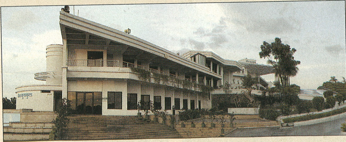
● जैन गुरुकुल