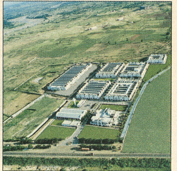
● जीआयएसएल फॅक्टरी