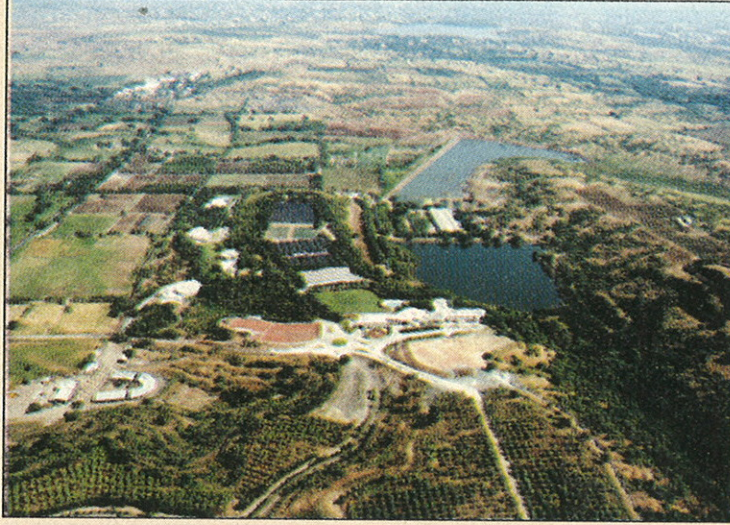
● जैन हिल्स - २००३

सौरऊर्जेवर पाणी तापविणारी यंत्रणा आम्ही यशस्वीरीत्या लोकांपर्यंत पोचवली आहे. त्यापाठोपाठ आता सौरऊर्जेवर चालणारे दिवे व अन्य घरगुती उपकरणेही येत आहेत. खेडोपाडी व शहरांतही विजेचा वाढता वापर, कमी पुरवठा, येणारे व्यत्यय, वाढणारा खर्च, ढासळणारा विश्वास पाहता सौरऊर्जा हे भविष्यातलं ऊर्जा पुरवठ्याचे खात्रीचं साधन राहिल यात शंका नाही.